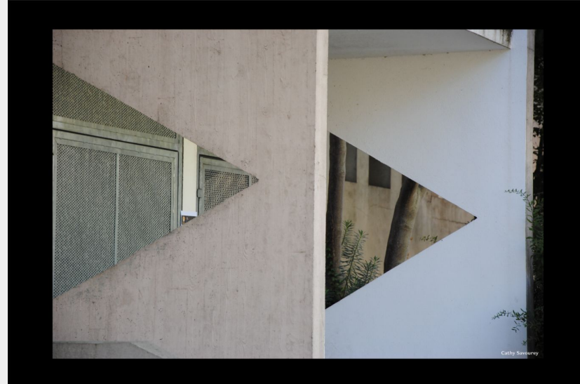
Exhibition Mon Sanitas