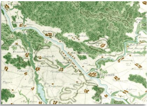
Color reconstruction (increasing legibility)