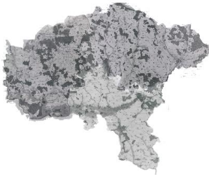
Georeferencing & mosaicking