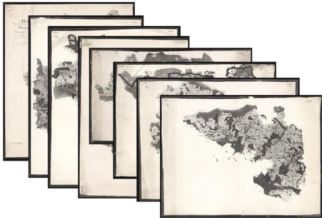
scanned (digitized) sheets